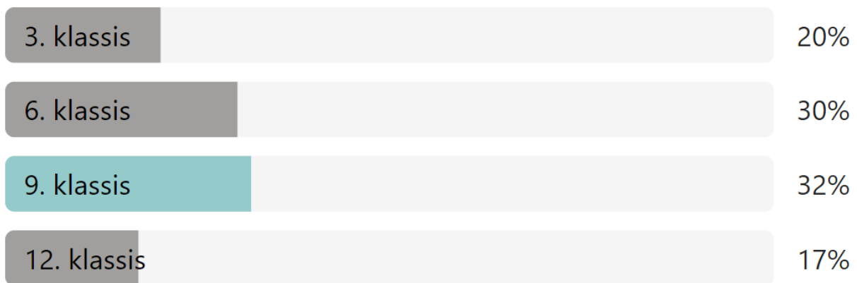
Joonis 1. Vastajate jagunemine klasside järgi (vastajate arv kokku 2 380).

Õpilastele suunatud küsitlusele vastasid iga õppeastme viimased klassid. III klassist 483 õpilast (20% vastanutest), VI klassis 721 õpilast (30% vastanutest) IX klassist 764 õpilast (32% vastanutest) ja XII klassist 415 õpilast (17% vastanutest) (joonis 1).